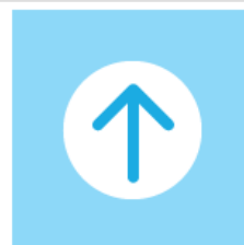
Specific Impact & Outcome Measures (63)