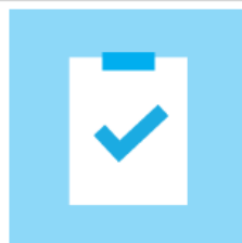
Surveys & Quick Feedback (13)