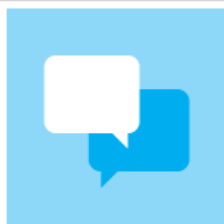
Support & Training (22)