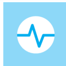
Diagnostic Tools (19)