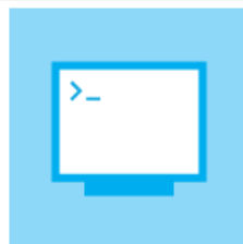
Database & Case Management Systems (9)