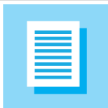
Guidance & Research Reports (75)